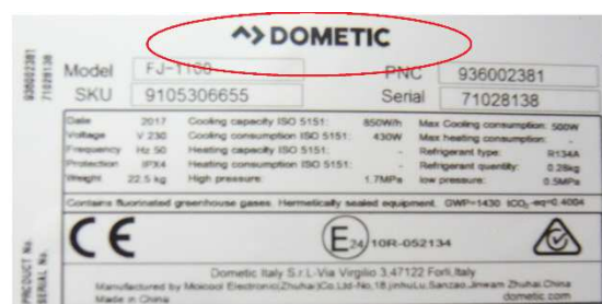
new brand / logo