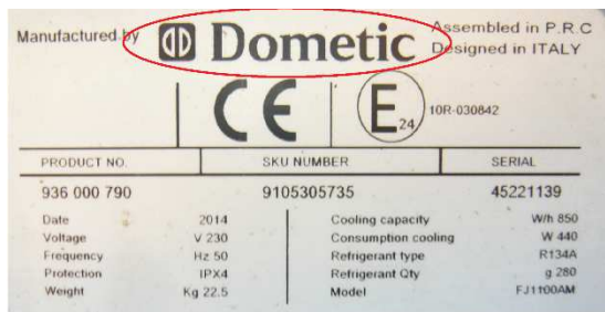
altes Branding / Logo

Bei den Klimaanlagen mit neuem Logo muss das DC Kit 3 (Inverter MSI1812T) verwendet werden.