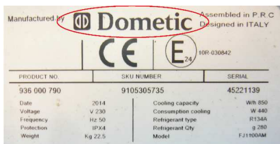
old brand / logo

With airconditioners with new Logo the DC kit 3 (Inverter MSI1812T) must be used.