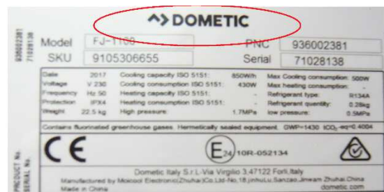
neues Branding / Logo