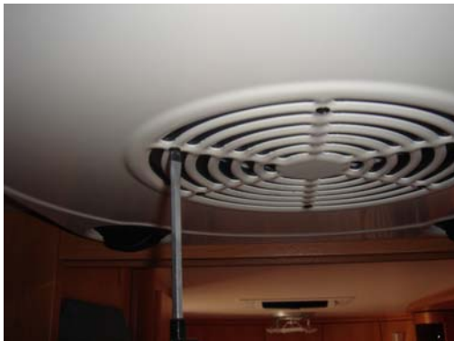
Abbildung 1: Figure 1:

Disconnect all power supplies when working on the roof air conditioner.