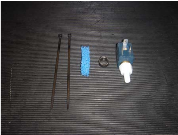
Abbildung 1: Figure 1:

Disconnect all power supplies when working on the roof air conditioner.