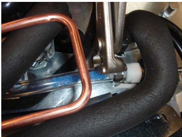
Abbildung 4: Figure 4: