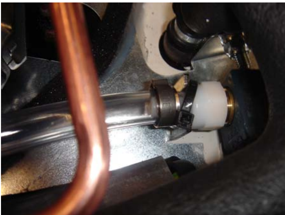
Abbildung 2: Figure 2: