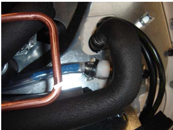
Abbildung 5: Figure 5: